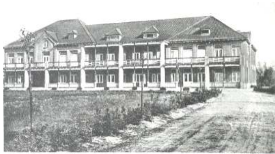
B. B. Elisabethziekenhuis - Winterswijk

Als ik zondagsdienst had en de nonnen mij om 6.30 uur niet in de kapel hadden gezien, moest ik 's middags van hen naar de kerk in het dorp.