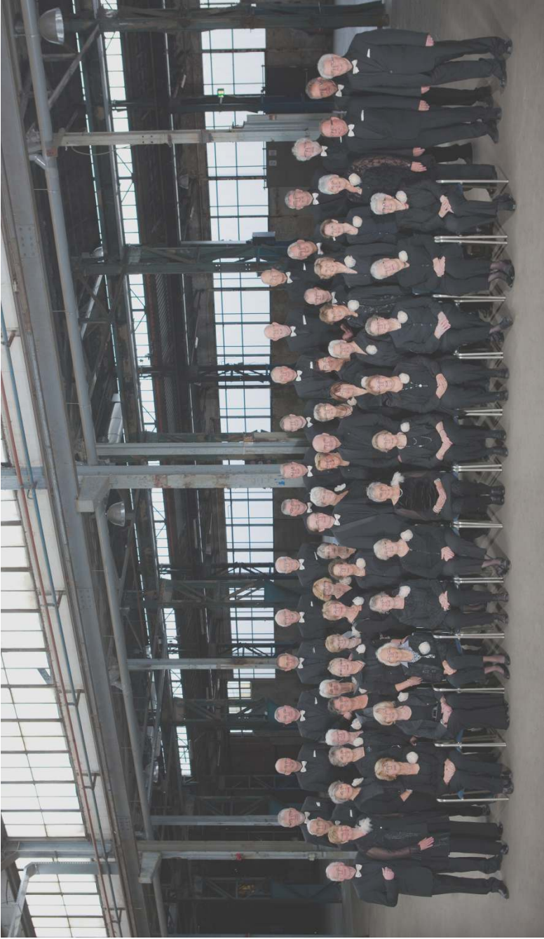
Ulfts Gemengd Koor Oktober 2013