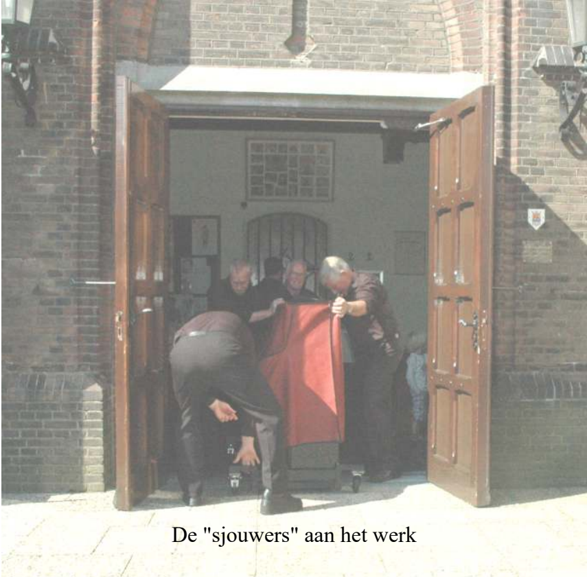
De "sjouwers" aan het werk

Daaronder de muziekcommissie en de redactie van het Koorvenster en als laatste een groepje zonder naam.