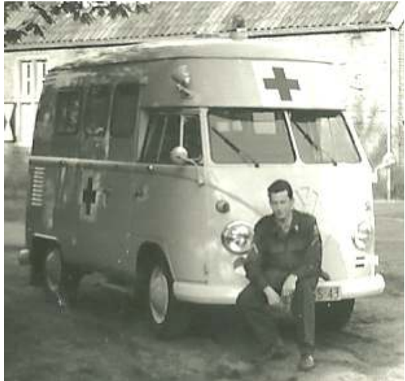
Schaarsbergen / Deelen (1964)