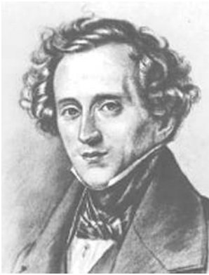
FELIX MENDELSSOHN-BARTHOLDY (vervolg)

In 1818 , op negenjarige leeftijd, trad Mendelssohn op in een openbaar kamerconcert en voordat hij dertien was had hij al verschillende composities op zijn naam, waaronder het pianokwartet opus 1 . Zijn vader was rijk genoeg om hem een privéorkest te laten dirigeren. Hij componeerde zijn eerste symfonie op vijftienjarige leeftijd.