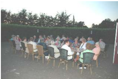
En het weer werkte mee