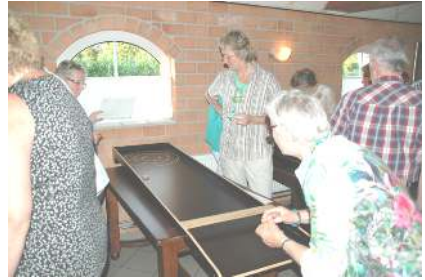
Opperste concentratie bij de vreemde sjoelbakken