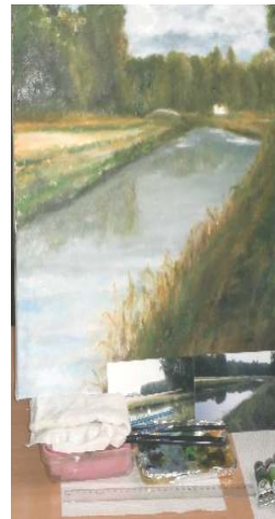
Schilderijen van de Oude IJssel (Strang)

We hebben veel mooie schilderijen van Liesbeths hand mogen bewonderen.