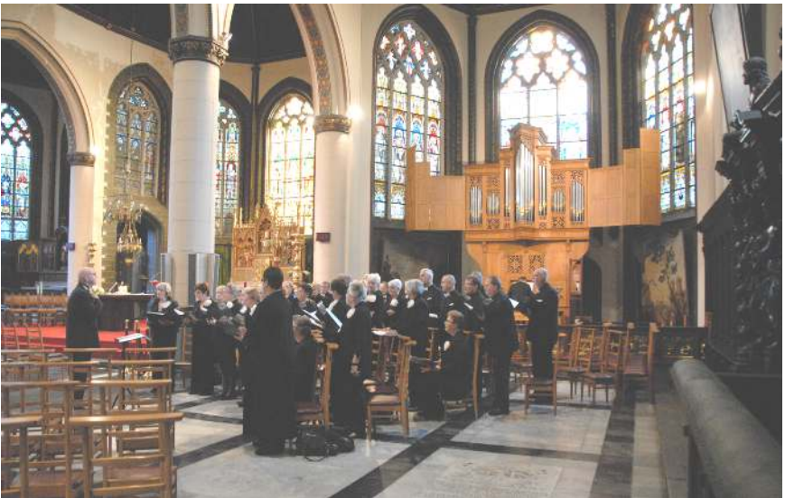
St. Gilliskerk Brugge