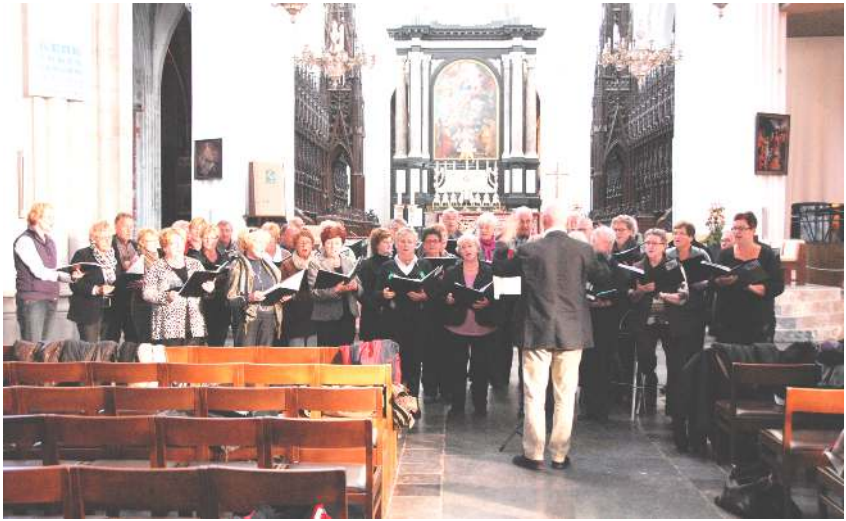
O.L.V. Kathedraal Antwerpen