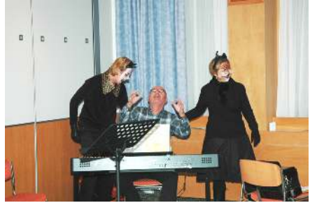
De katjes Marion en Frieda