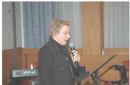
Riet: 'Brieven aan verzekeringen'