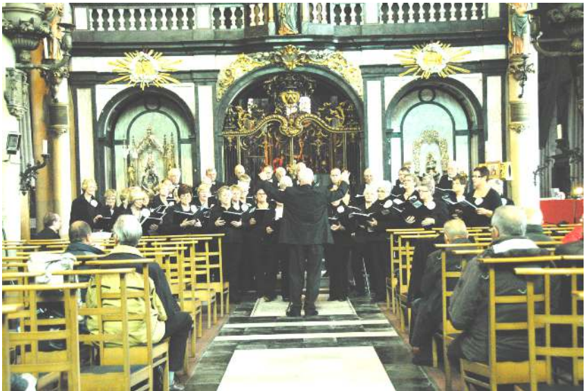
O.L.V. Basiliek Brugge