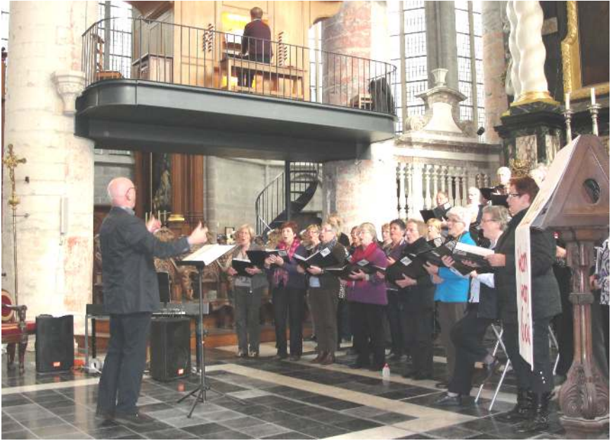
St. Nikolaaskerk Gent