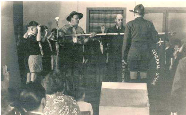
FOTO 2: Meubeltransport Ook op feestavonden werd er gezongen. Op de foto zie je de installatie van de Generaal Spoor groep. Links op de foto is mijn vader. Nu zing ik bij het UGK we hebben

een goede dirigent en het is heel gezellig. Ik ga met plezier naar de repetities.